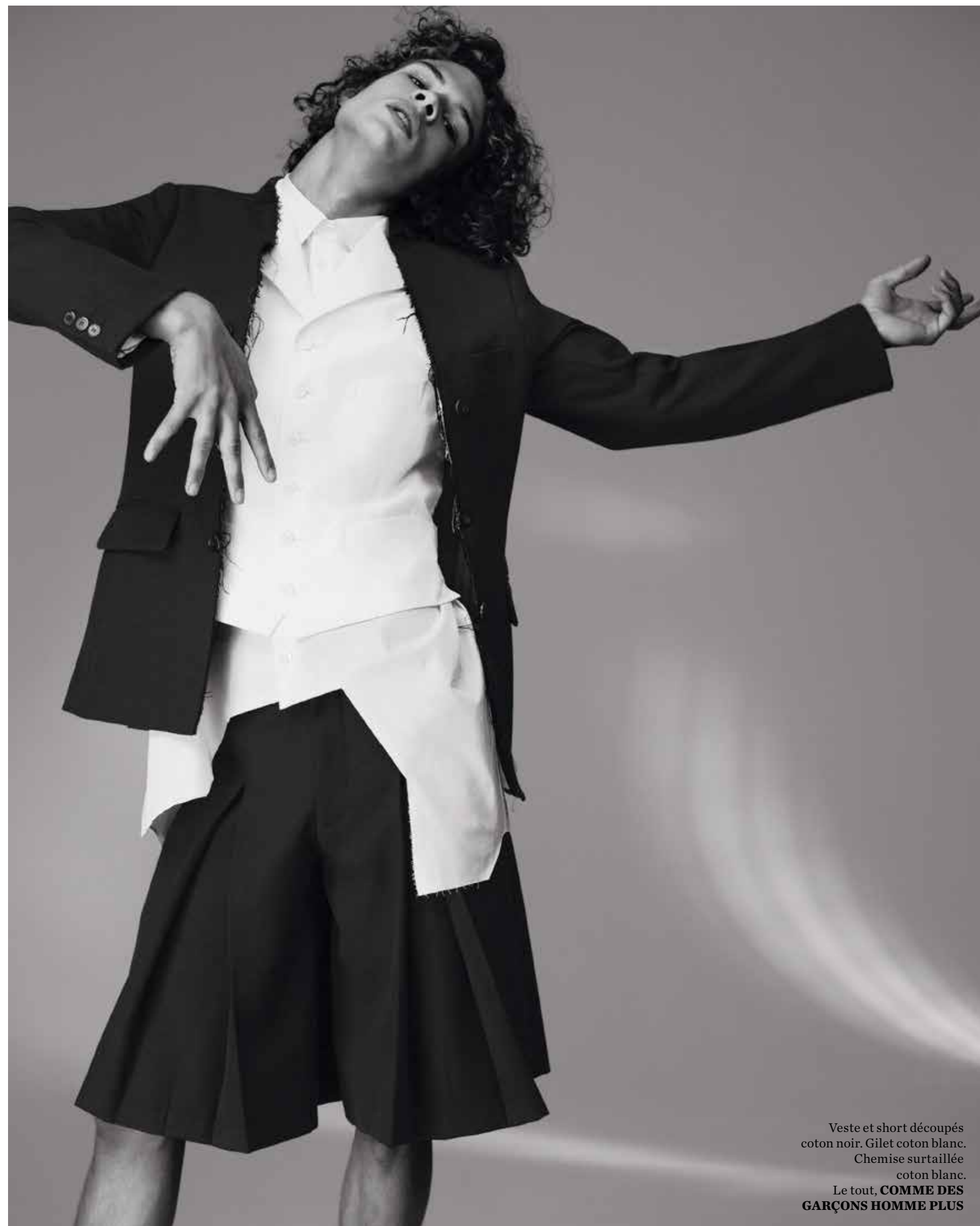
Veste et short découpés coton noir. Gilet coton blanc. Chemise surtaillée coton blanc. Le tout, COMME DES GARÇONS HOMME PLUS