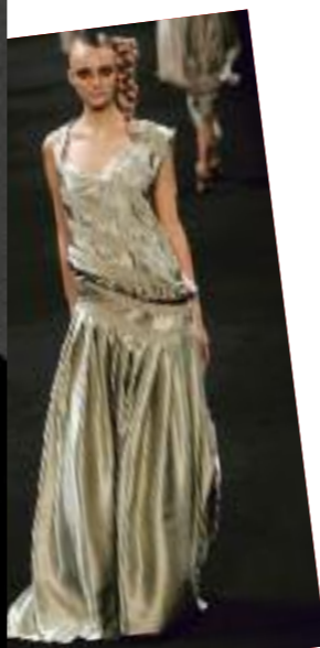
Collection Viktor & Rolf printemps-été 2006