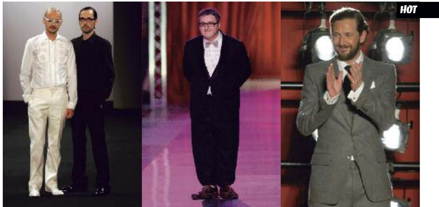
Viktor & Rolf, Alber Elbaz et Stefano Pilati