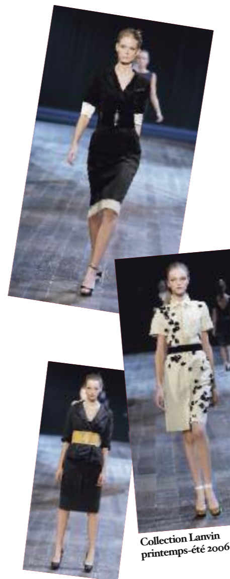
Collection Lanvin printemps-été 2006

Robe en satin écru au plissé drapé et décolleté retenu par un nœud obi Manteau de jour en tissu papier écru Les deux, Lanvin